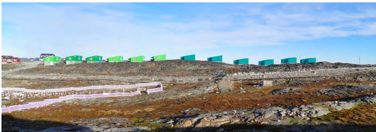
Immikkoortortaq kujataaniit. Sanaartukkat nutaat illutut tungujortutut nalunaagaapput. Området set fra syd. Den nye bebyggelse er markeret som blå huse.