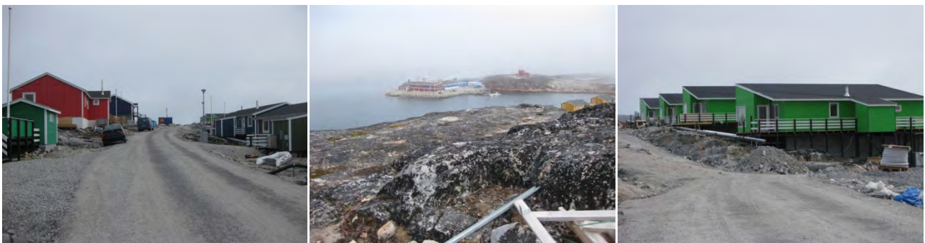
Immikkoortortap ilaa ullumi. Delområdet i dag.

I forbindelse med etableringen af en del af enfamiliehusene har det af terrænmæssige årsager vist sig hensigtsmæssigt at give en række af byggefelterne en anden placering. Dette kommuneplantillæg er derfor udarbejdet for at justere placeringen af en del af områdets bebyggelse.