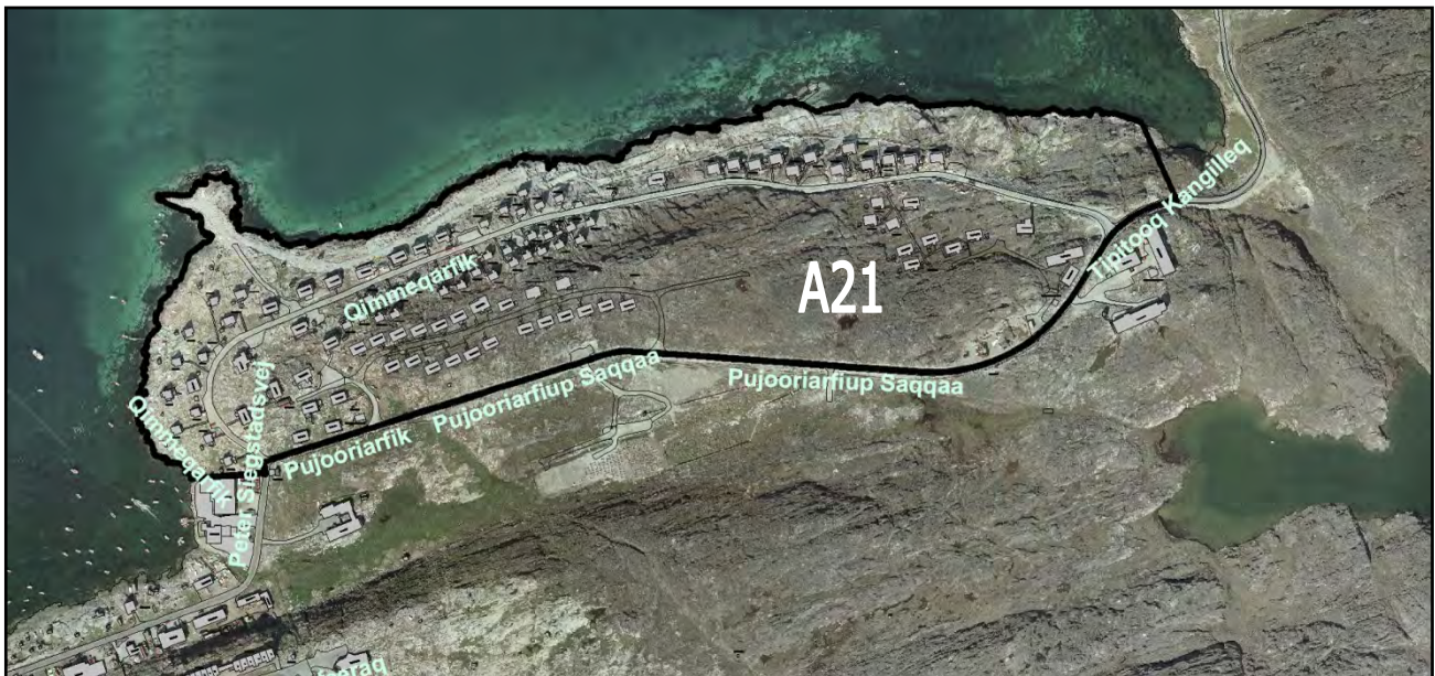
Immikkoortortap ilaa ullumi. Delområdet i dag.

Delområdet ligger i den nordøstlige del af Aasiaat – mellem Qimmeqarfik og Pujooriarfiup Saqqa. Området er beliggende på en højtliggende fjeldknold med den for Aasiaat karakteristiske landskabsform: terrænet har kurver, der er øst-vestgående. Området er orienteret mod nord, idet udsigten ud over ishavet er mod nord. Bebyggelsen i Aasiat har derfor det karakteristiske træk, at alle udsigts-/stuevinduer er vendt mod nord. Dette træk er bevaret i bebyggelsesplanen for de nye byggefelter i detailområdet A21.2.