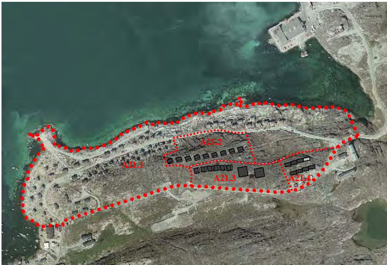
Imm. ilaa, ann. immikkoortortat sanaartorfissallu. Delområdet, detailområder, byggefelter.

Inissianut nutaanut sanaartorfissat ima atugassiaapput immikkoortortami sanaartukkatut ilusaareersumut sanaartukkat nutaat naleqqussagaassallutik, nunaannartamillu malinnaasinneqarlutik. Taamaalilluni illoqarfimmi sumiiffimmi malunnaatilimmi tassani sanaartukkat ataqtigiissaartutut iluseqalissapput. Sanaartukkat nutaat pingaarnertut tamaani aqqusinniamut, immikkoortortamik tamarmik pilersuisumut atuartillugit inissinneqassapput.