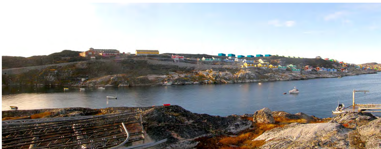
Immikkoortortaq kujataaniit. Sanaartukkat nutaat illutut tungujortutut nalunaagaapput. Området set fra syd. Den nye bebyggelse er markeret som blå huse.

For at sikre at karakteren af boligområdet fastholdes, skal bebyggelse til vandrehjem udformes, så bebyggelsen indpasses i området som helhed. Derfor fastlægges bestemmelse om, at højde, taghældning og farver skal tilpasses områdets øvrige etagehusbebyggelser.